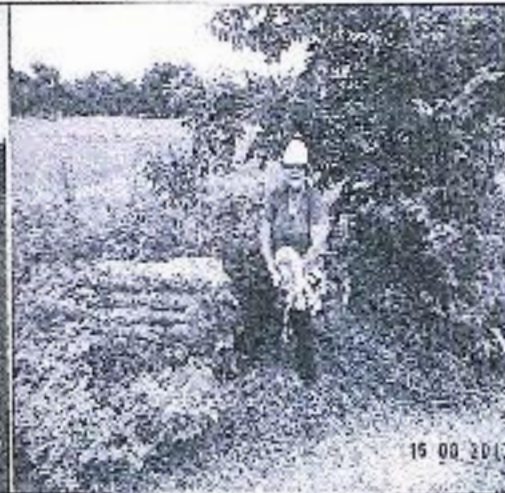
REALIZACION DEL ACTA CON PETICIONARIA