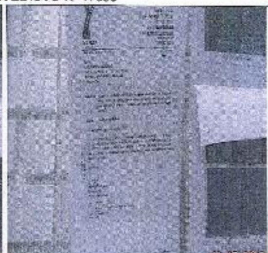
PUBLICACION POR EDICTO R_17583