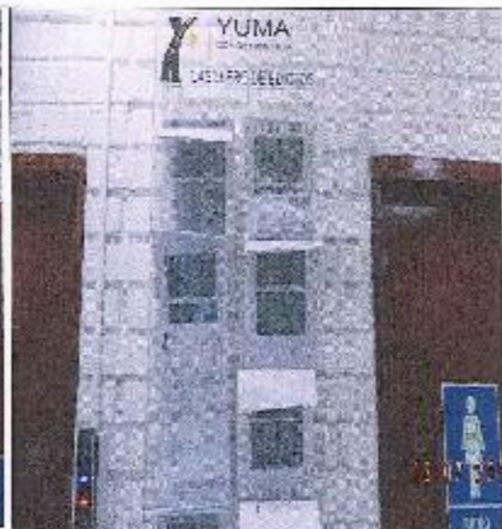
PUBLICACION POR EDICTO R- 17583